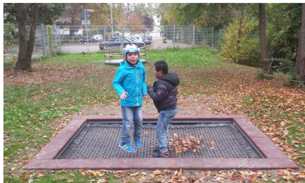
Begeisterung auf dem vom Förderverein finanzierten Boden - Trampolin

Förderverein der Regenbogen-Schule e.V. IBAN: DE90 6905 0001 0000 1541 95 BIC: SOLADES1KNZ