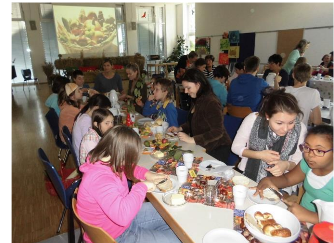
Bild vom Erntedankfest in der Regenbogen-Schule: Der Förderverein unterstützt die Schulgemeinschaft.

Der Mitgliedsbeitrag beträgt mindestens 15 Euro pro Jahr.