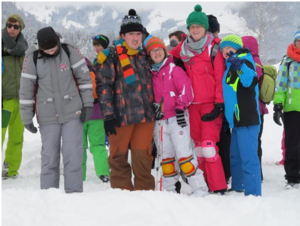
Schullandheim: Eine wichtige Erfahrung.