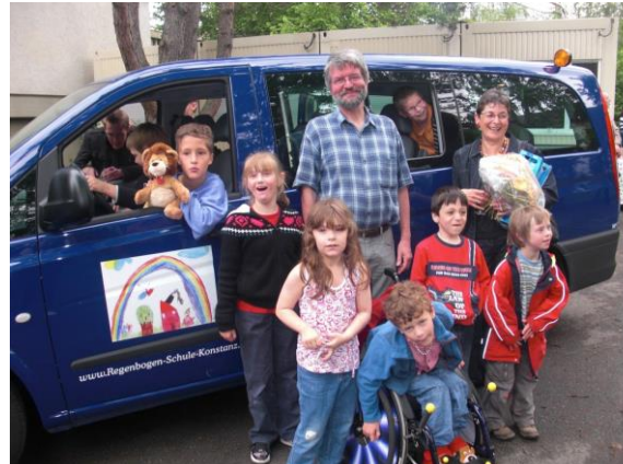
Damit ALLE mitmachen können: Die schuleigenen Busse sind bedarfsgerecht ausgestattet.