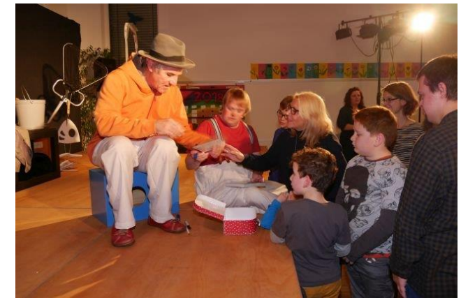
Bild vom Theaterabend „Clown-Syndrom“ an der Regenbogen-Schule: Der Förderverein unterstützt die Schulgemeinschaft.

Der Mitgliedsbeitrag beträgt mindestens 15 Euro pro Jahr.