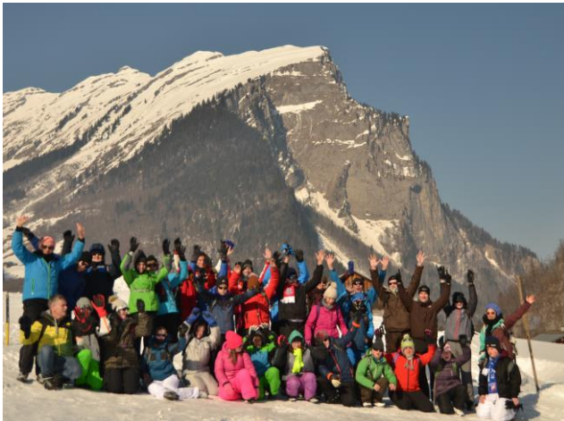
Schullandheim: Eine wichtige Erfahrung.