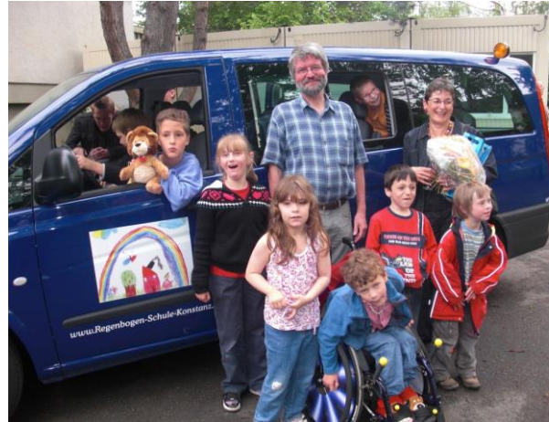
Damit alle mitmachen können: Der schuleigene Bus ist behindertengerecht ausgestattet.