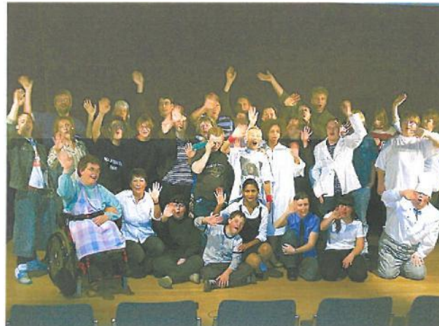
Begeisterung auf der Bühne und im Publikum: Der Förderverein finanzierte das Theaterprojekt „Blaukunst“.

Förderverein der Regenbogen-Schule DE90690500010000154195 BIC SOLADES1KNZ Sparkasse Bodensee